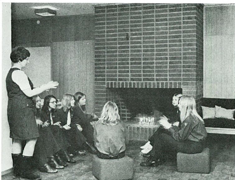
Det är skönt och trivsamt kring brasan.

Bilderna här visar en grupp av kyrkans juniorer nere i ungdomsavdelningen.