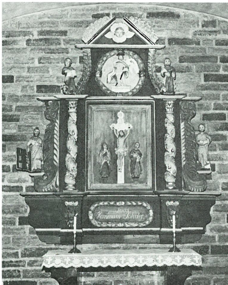
Friggeråkers gamla kyrkas altar uppsats i den nya kyrkan.