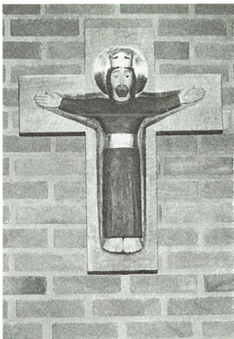
Krucifixet har tillkommit genom donation av anonym givare. Det är ritat och skulpterat av konstnärinnan Eva Spånberg, Växjö, som gett följande tolkning av sitt konstverk.

Konsthistoriskt anknyter detta krucifix till tiden före 1200-talet, då man framställde Kristus såsom segrare, såsom den gudomlige konungen och Herren.