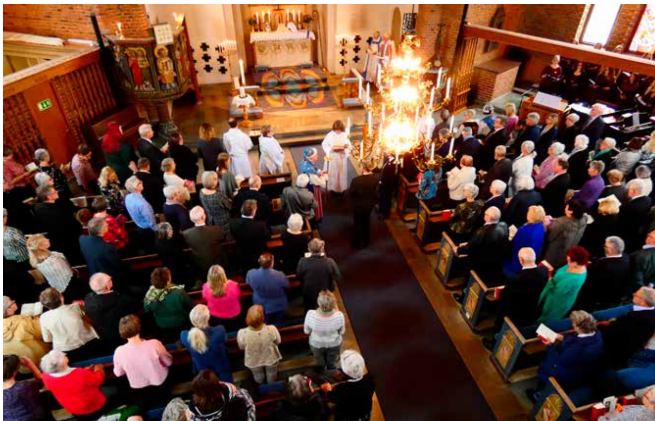
Det var mycket folk som ville vara med när Snöstorps församling tog emot sin nya kyrkoherde.

”Att vara människa är att ständigt lära sig nya saker. Att vara kyrka är att ständigt lära sig nya saker”.