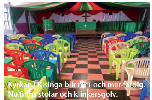
Kyrkan i Kisinga blir mer och mer färdig. Nu finns stolar och klinkersgolv.