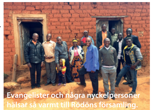
Evangelister och några nyckelpersoner hälsar så varmt till Rödöns församling.