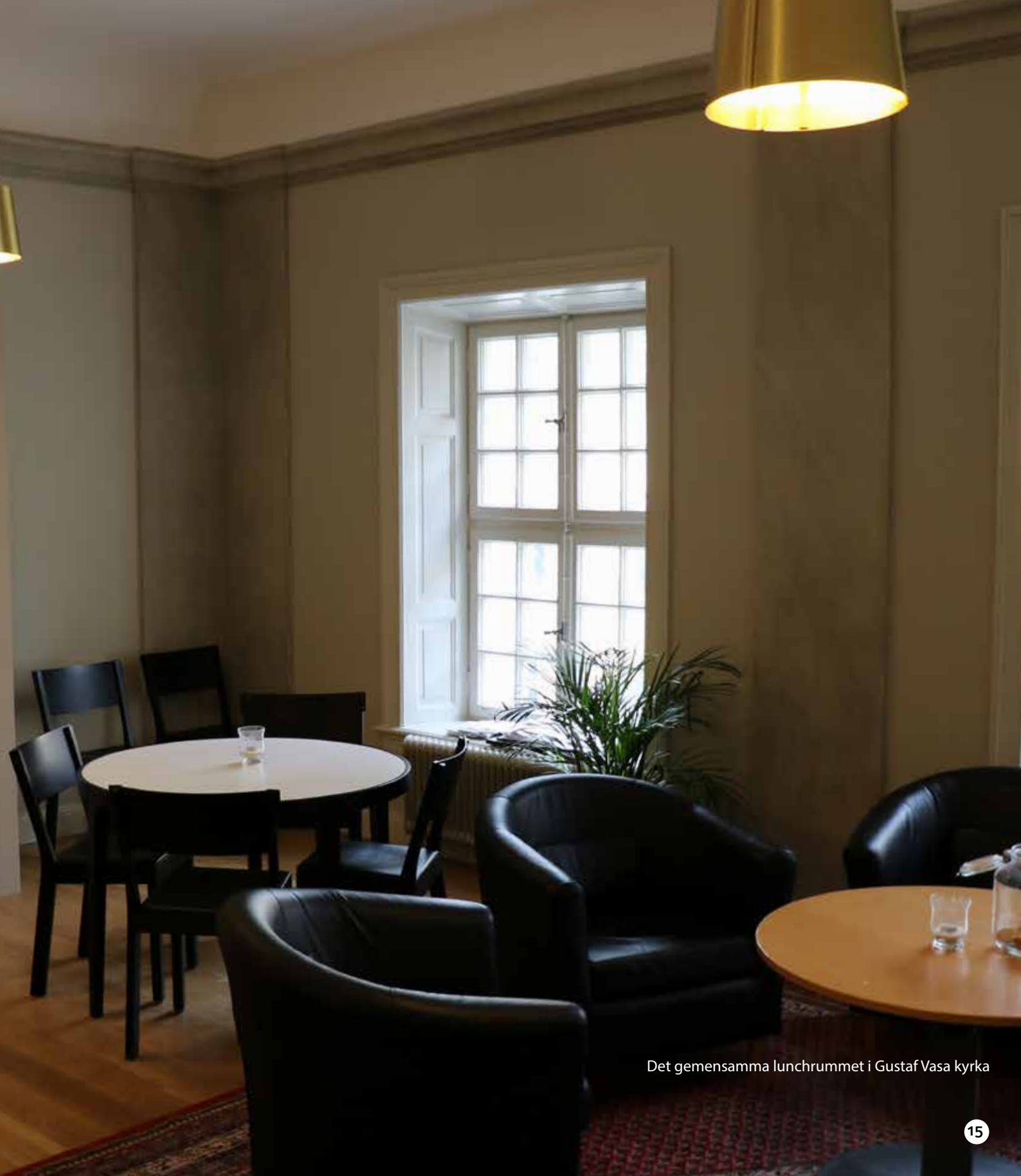
Det gemensamma lunchrummet i Gustaf Vasa kyrka