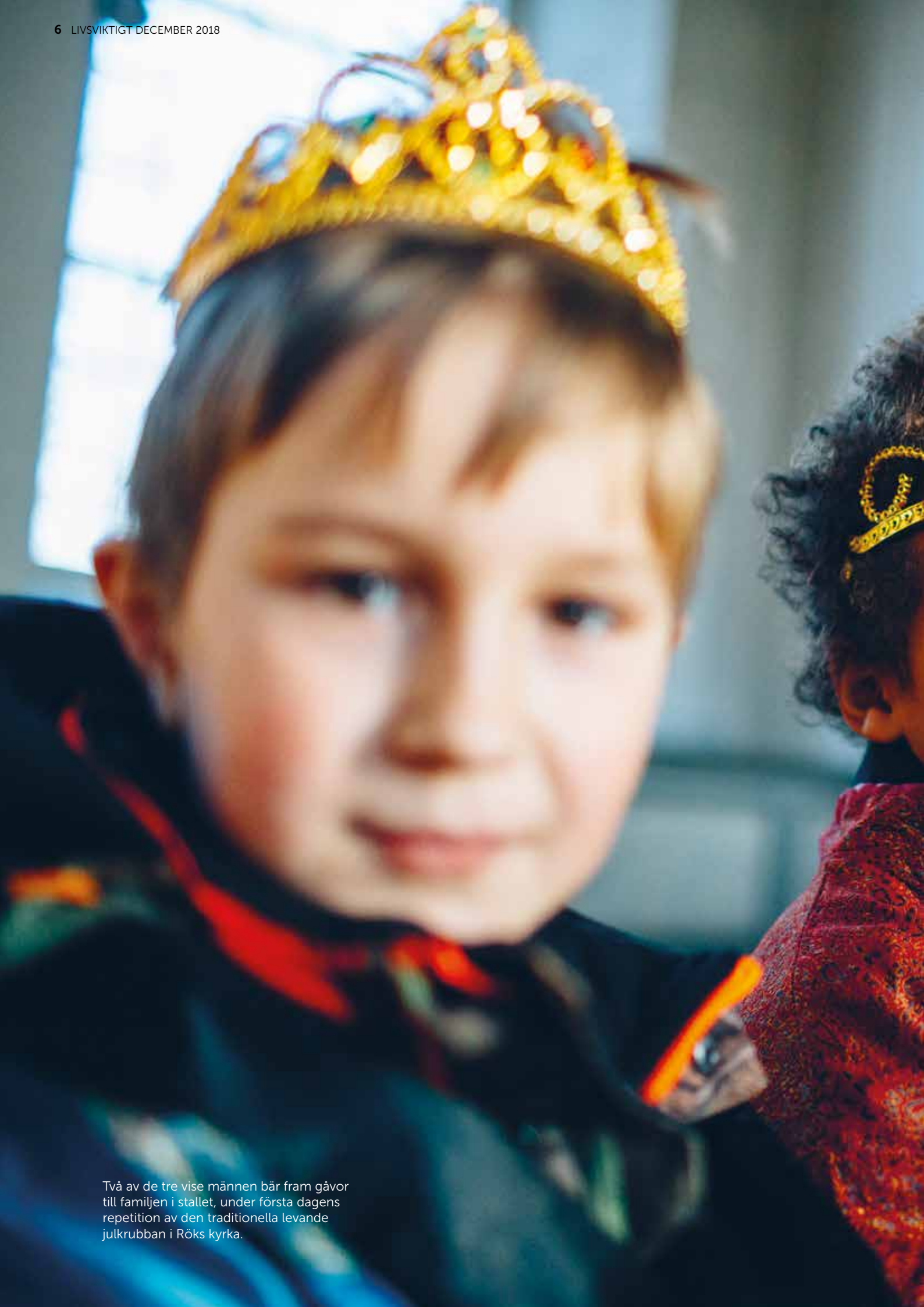
Två av de tre vise männen bär fram gåvor till familjen i stallet, under första dagens repetition av den traditionella levande julkrubban i Röks kyrka.