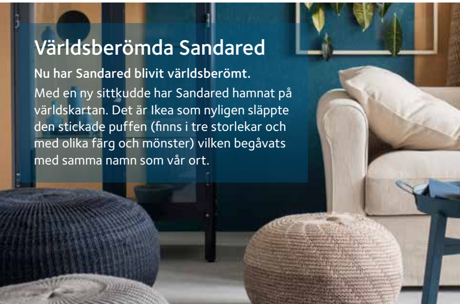
BILD: IKEA, SITTKUDE SANDARED