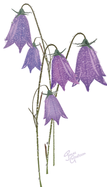
LITEN BLÅKLOCKA Campanula rotundifolia

Så var det äntligen dags för Kyrksurret?