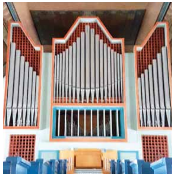
ORGELN LIMA KYRKA

träkyrkan finns bevarad samt dörrhandtaget. Dörrhandtaget bär tydliga spår från vikingatid, den är troligen från 1200-talet, möjligen är den en tillvaratagen rest från förkristen tid. Den första stenkyrkan uppfördes på den nuvarande kyrkans plats, troligen under 1440-talet. Kyrkan