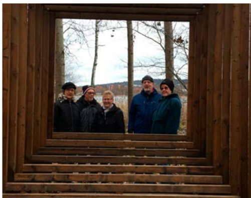
Vandragruppen gick runt Rocksjön 15/11.