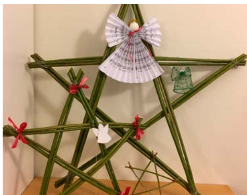
Stjärnor och änglar från slöjdcafé i Kyrkvillan 17/10.