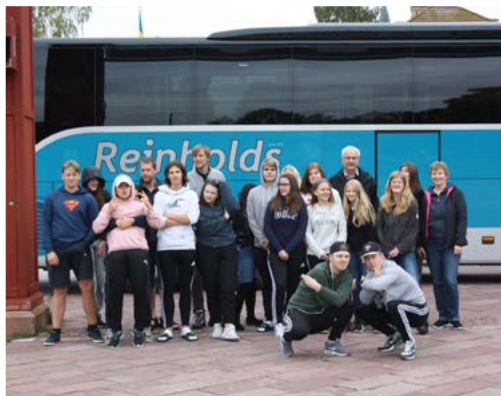
Unga ledare i Mora, på väg till Östersund, 22/9.