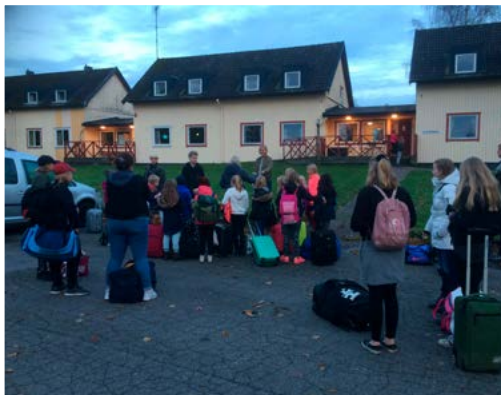
Ankomst till barnläger på stiftsgården Tallnäs 27/10.