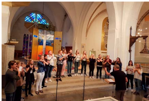
Con Spirito på ungdomskördag i Växjö domkyrka 16/9.