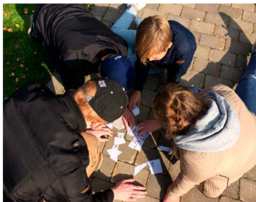
Konfirmander pusslar ihop Vår Fader i Sandseryd 1/10.