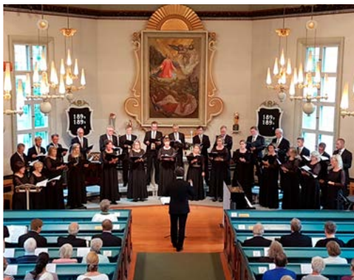
Jönköpings kammarkör och Norrahammar-Hovslätts kyrkokör samsjög i musikgudstjänsten "Glädjens i Herren" i Norrahammars kyrka 27/8.