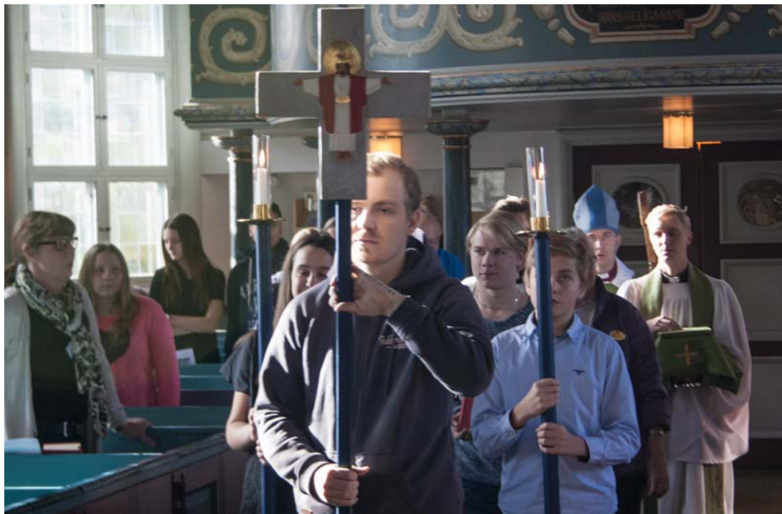
Ungdomsmässa med biskopen, Norrahammars kyrka 16 oktober.

Under 10 års tid har Norrahammars församling haft en ledarutbildning för ungdomar som hjälper till i barn- och ungdomsgrupper, konfirmandarbetet, körer mm. Unga ledare gör ett fint arbete i församlingen och det är därför viktigt att de ges möjlighet att växa och utvecklas. Det är viktigt att ta unga människor på allvar och unga ledare finns också med som en punkt i riktlinjerna för konfirmandarbetet där man skriver: