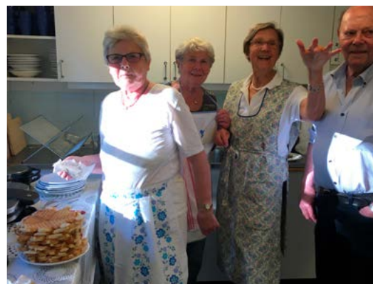
Våffelväll på Stenbäcken.