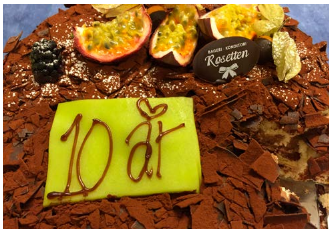
En av tre smarriga jubileumstårter!