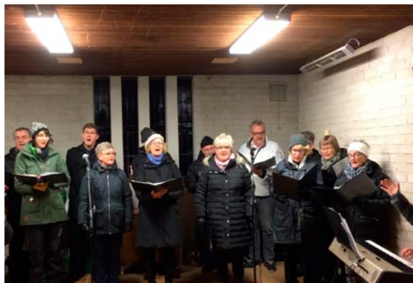
Ekumenisk kör medverkade vid andakt i det gamla kapellet på Norrahammars kyrkogård, Alla Helgons dag.