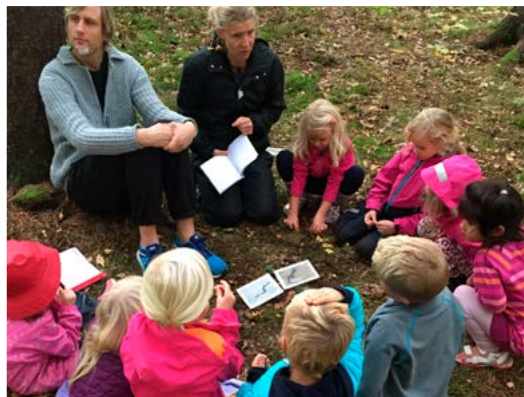
Kontakten-gruppen samlas på Grästorp.