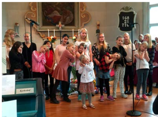
Barnkör sjöng på skörde gudstjänst i Norrahammars kyrka 9 oktober.