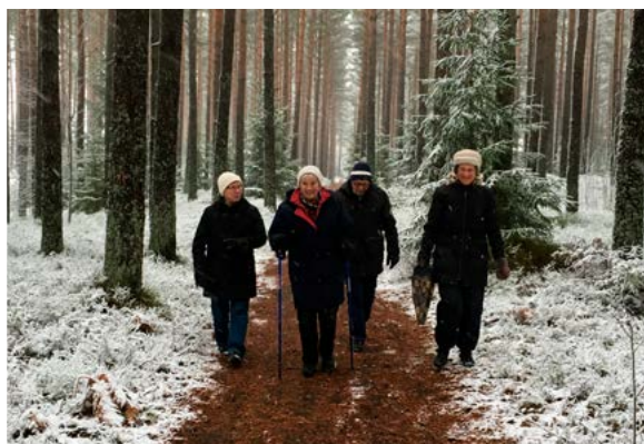
Vandrargruppen i första snön, Torsvikskogen 2 november.