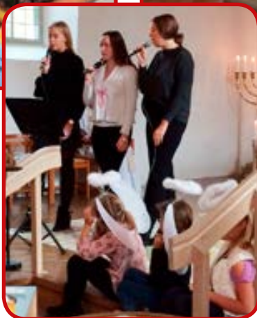
Young Voices och en liten skara änglakör sjöng vackert i Kulltorps kyrka.