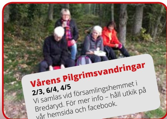
Vårens Pilgrimsvandringar 2/3, 6/4, 4/5 Vi samlas vid församlingshemmet i Bredaryd. För mer info - håll utkik på vår hemsida och facebook.