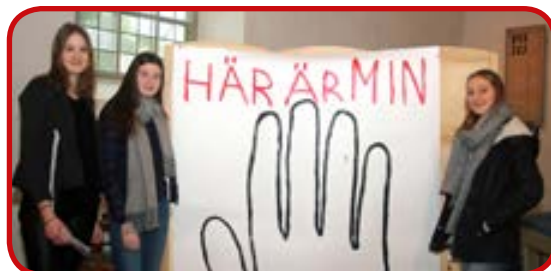
2017 års mässa hade temat "Här är min hand".