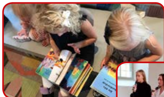
Bibelutdelning till 4 åringar, spännande bibel som bläddrades i på en gång

Vi har firat Himlajus med dopkalas tillsammans med barnkören i Bredaryds kyrka och med Young Voices i Kulltorps kyrka.