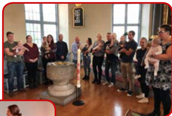
Under dopkalaset delades dopänglar ut till barn döpta under 2018 i Bredaryds kyrka.