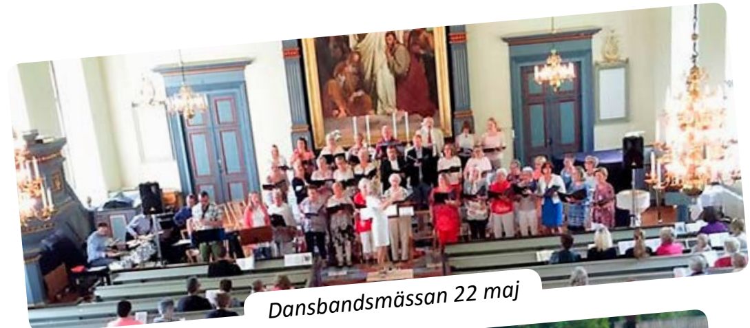
Dansbandsmässan 22 maj