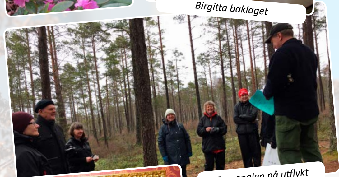
Personalen på utflykt