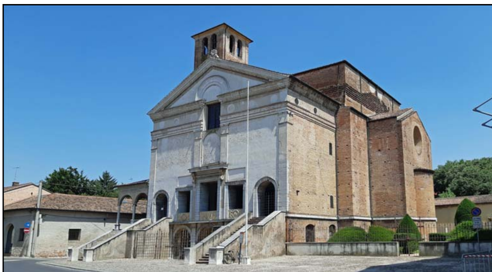
San Sebastiano i Mantua, ritad av Leon Battista Alberti, men aldrig fullbordad. Ingångsfasaden saknar pelare och kyrkan skulle troligen ha täckts av marmor.