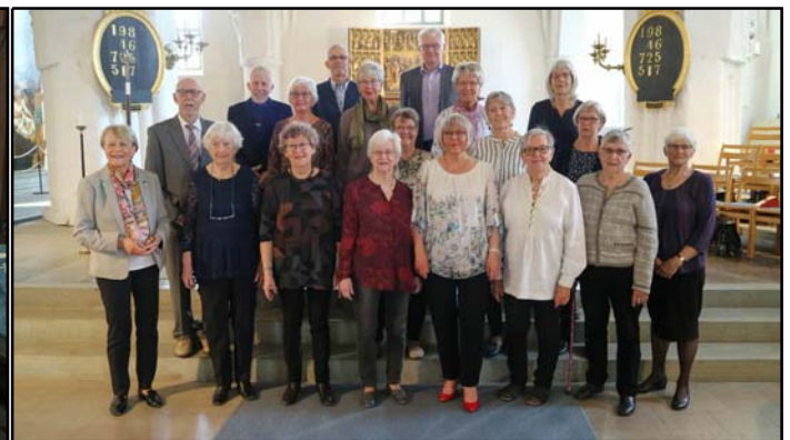
I S:t Ragnhildskörens traditionella program "Hela kyrkan sjunger" i Farleds kyrkan i Skällvik varvades körsång med allsång av kända och älskade psalmer.