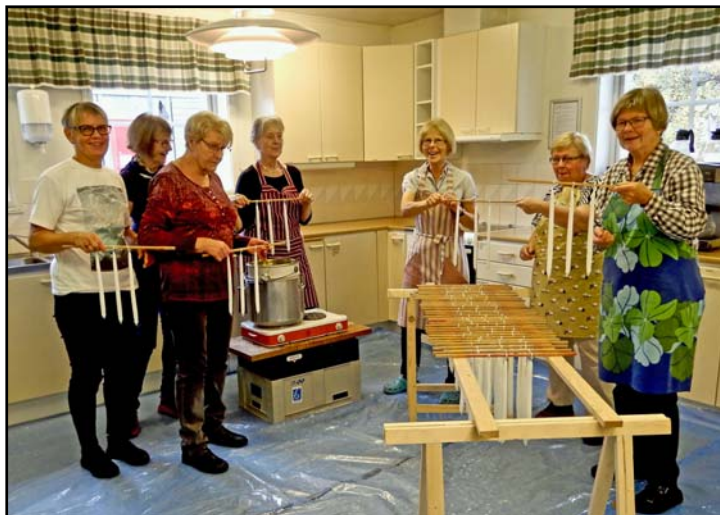
Ljustöppning till förmån för julinsamlingen 2019.