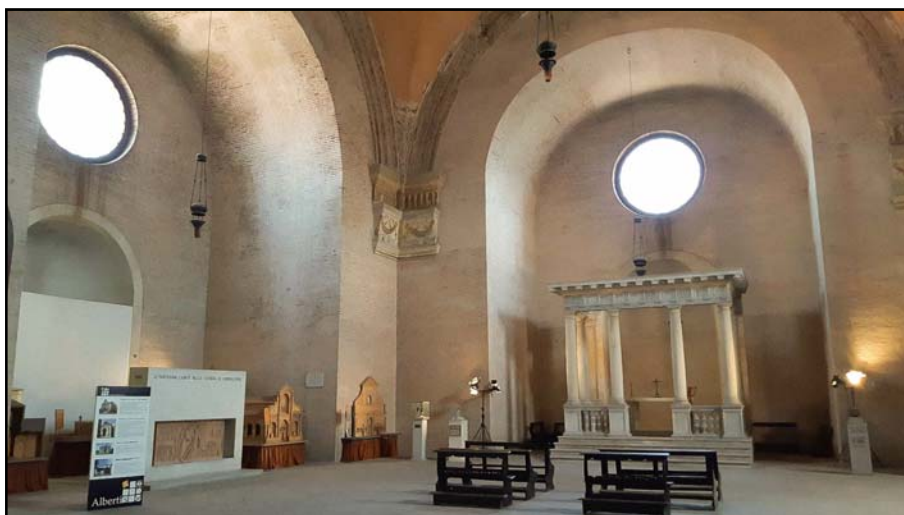
Interiören av San Sebastiano. Kyrkan fungerar idag som museum.