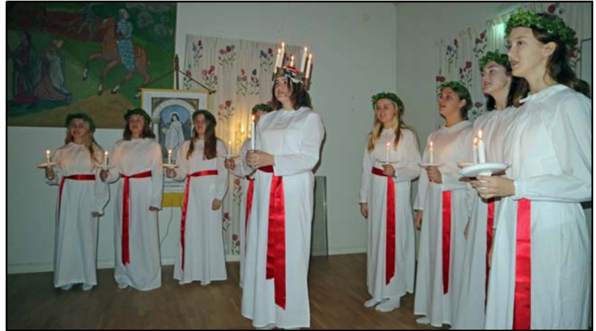
Söderköpings Lucia med tärnor 2018 i Drothems församlingshem.

Den ursprungliga legenden om Sankta Lucia, helgonet från Syracusa på Sicilien, berättar att Lucia hade gett ett löfte till Gud om att inte gifta sig, utan istället ge allt hon ägde till de fattiga. Men när den man som blivit lovad att gifta sig med henne förstod, att det aldrig skulle bli något bröllop, anger han henne för den romerske kejsaren Diocletianus, en av de värsta tyrannerna på den romerska kejsartronen. Hon kastas i fängelse och får utstå svår tortyr, bland annat bränns hon på bål utan att elden kan förtära henne — därifrån troligtvis traditionen om Lucia som bärare av ljuset, och luciakronan med ljus en symbol för lågorna som inte lyckades förgöra henne. Efter många försök att ta hennes liv lider hon till sist martyrdöden, troligtvis år 304 e. Kr. På Sicilien firas Sankta Lucia med en stor ljusfest då man bär hennes bild i fackeltåg till ett stort bål som tänds på torget. Vårt luciafirande i Skandinavien har dock inte mycket gemensamt med den