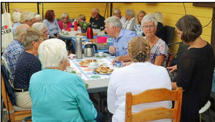
Friluftsgudstjänsten i Nygård "I Predikare-Lenas fotspår" lockade en hel del och flera än förra året. Familjen Svensson bjöd generöst på fika och bröd.