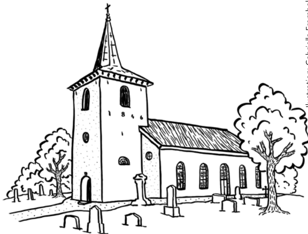
Illustration: Gabriella Fromholt