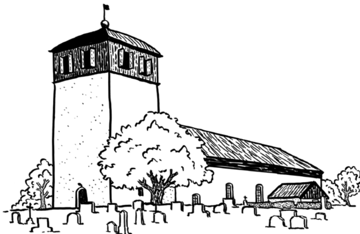
Illustration: Gabriella Fromholt