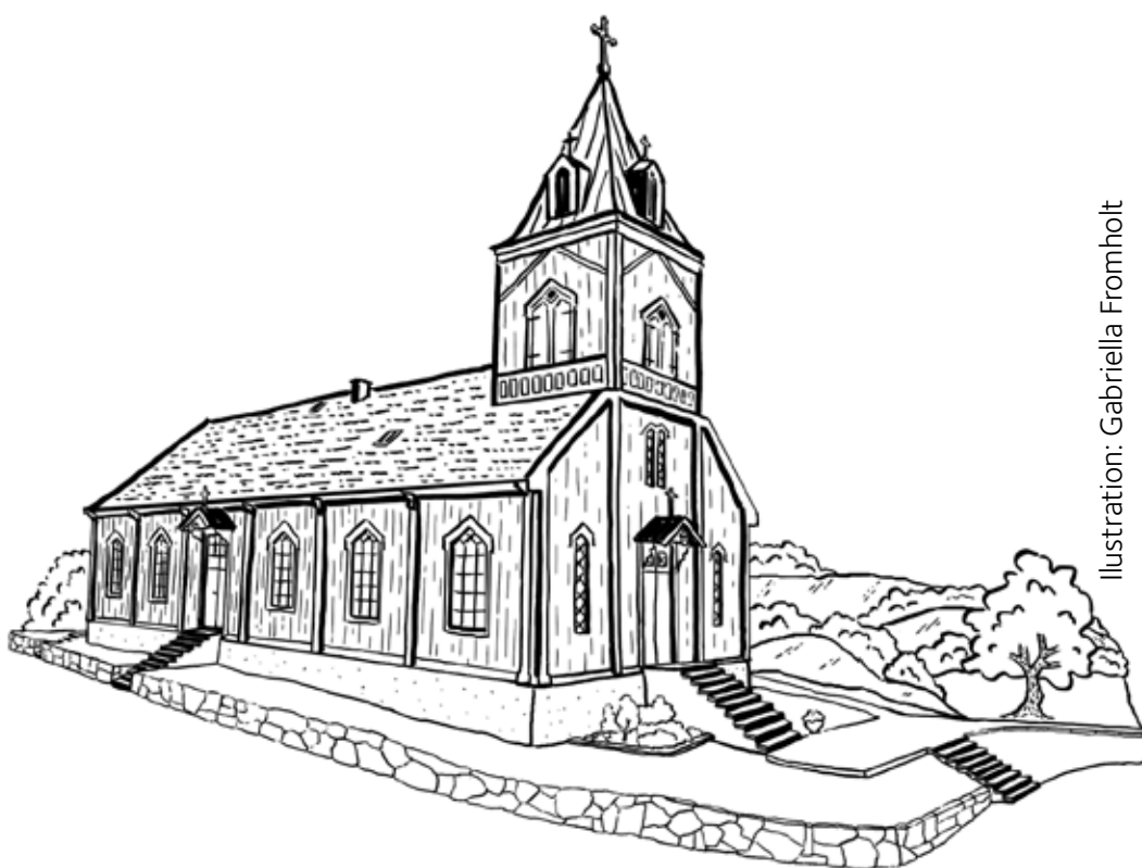
Illustration: Gabriella Fromholt