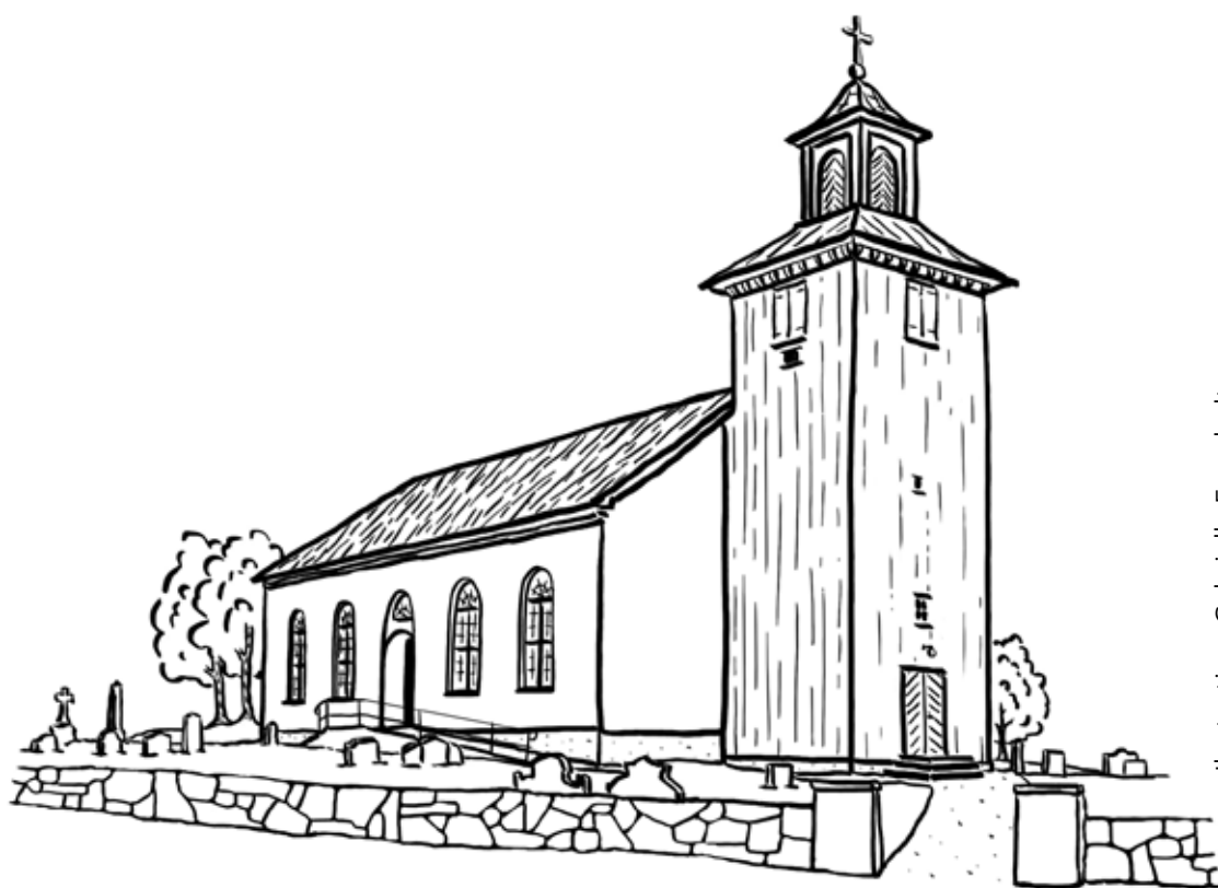
Illustration: Gabriella Fromholt