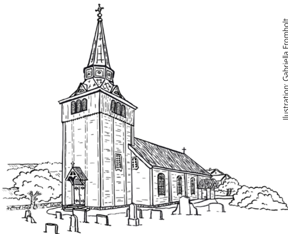
Illustration: Gabriella Fromholt