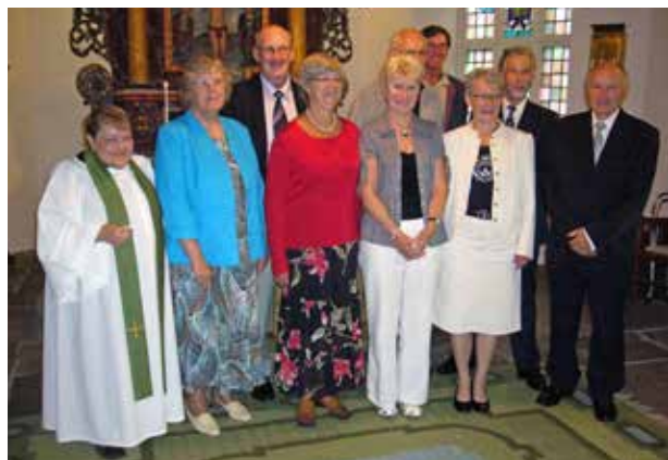
Foto från 2007, 50-årigt jubileum i Gunnarsnäs kyrka