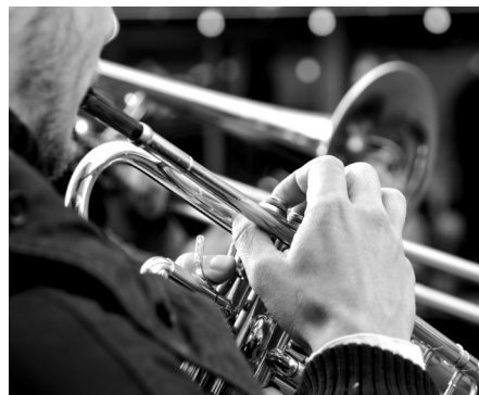
"Sommarvind" - 16 augusti.