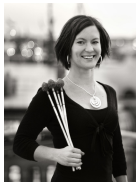
"Marimbatoner" - 9 augusti.