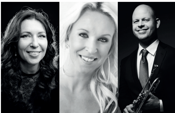
"Från Duvemåla till månen" - 26 juli.