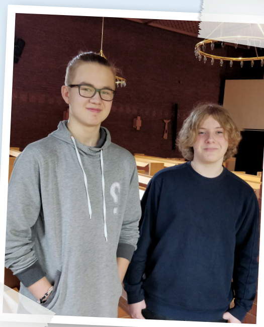
TEXT & FOTO: PER JONSSON

William: Ja det tror jag nog. Någon gång kring jul. Då är det extra fint att gå i kyrkan.