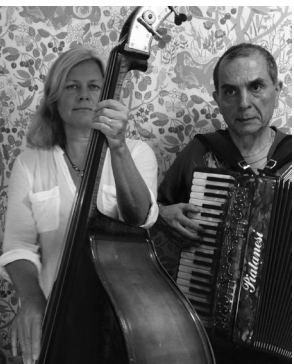
"En tango för den fattige" - 2 augusti.