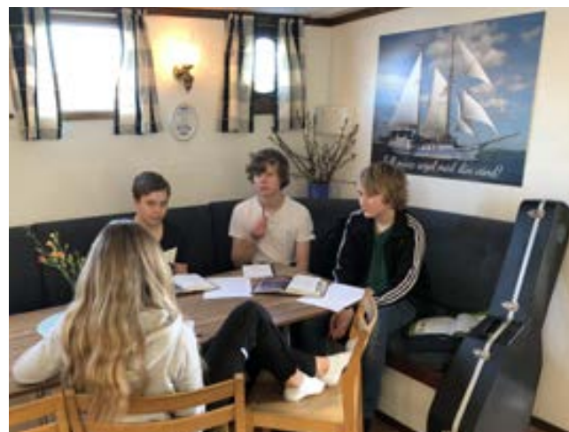
Konfirmandläger med båten Shalom