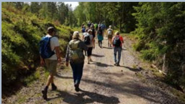
Pilgrimsvandringen i början av juni Prästaleden från Norra Unnaryd till Valdshult.