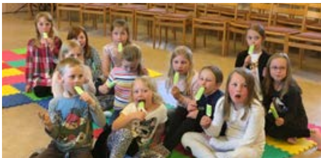
Barnen i barnkören Sångfågarna