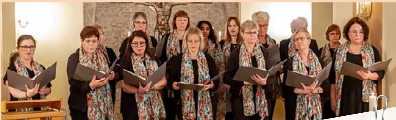
Sång i Svenska kyrkan i Rom