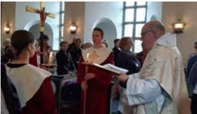
Folkmusikmässan "Träd in i dansen" hölls söndagen den 5 maj där Mixturen, Stenbrohults kyrkokör, Virestads folkdanslag och instrumentalister medverkade.