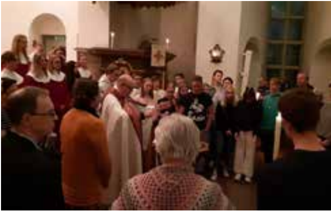
Påsknattsmässan inleds vid påskelden där påskljuset tänds. Under mässan sker även en doplöftesförnyelse. Många människor fyllde Älmhults kyrka och Jubilatekören sjöng.