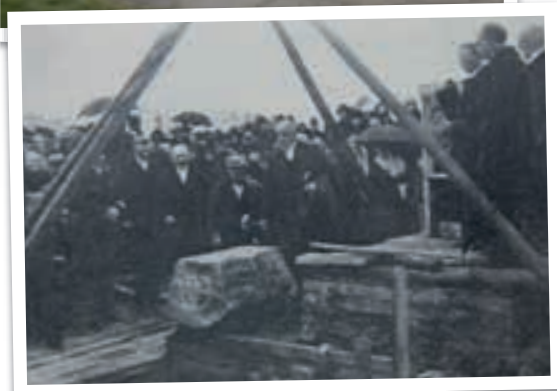
Överst: Grundstenen med röd ring i bilden. Cirkel: Grundstenen i närbild. Nederst: Då grundstenen lades.