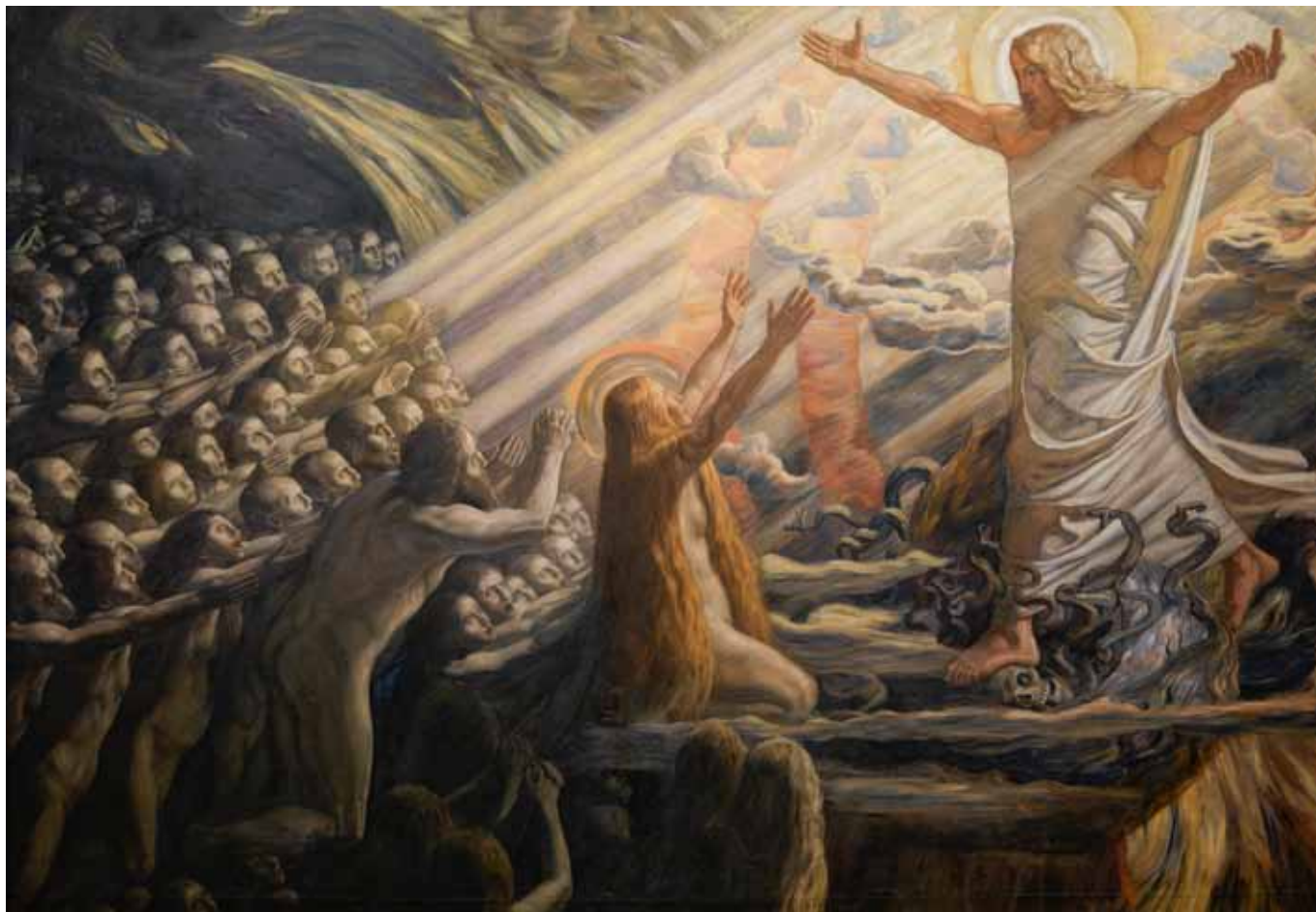
Kristus i de dødes rige. Olja på duk av J. Skovgaard, målad 1891-94 (Statens Museum for Kunst).