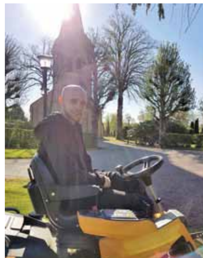
Calle i begrepp att klippa gräs.

Välkomna att besöka kyrkogårdarna. Jag tar mig gärna tid för att prata och svara på frågor.