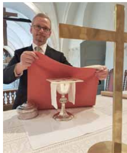
Ronny dukar altaret.

Det skulle vara trevligt att se lika många i kyrkan som man ser gå runt på kyrkogården.