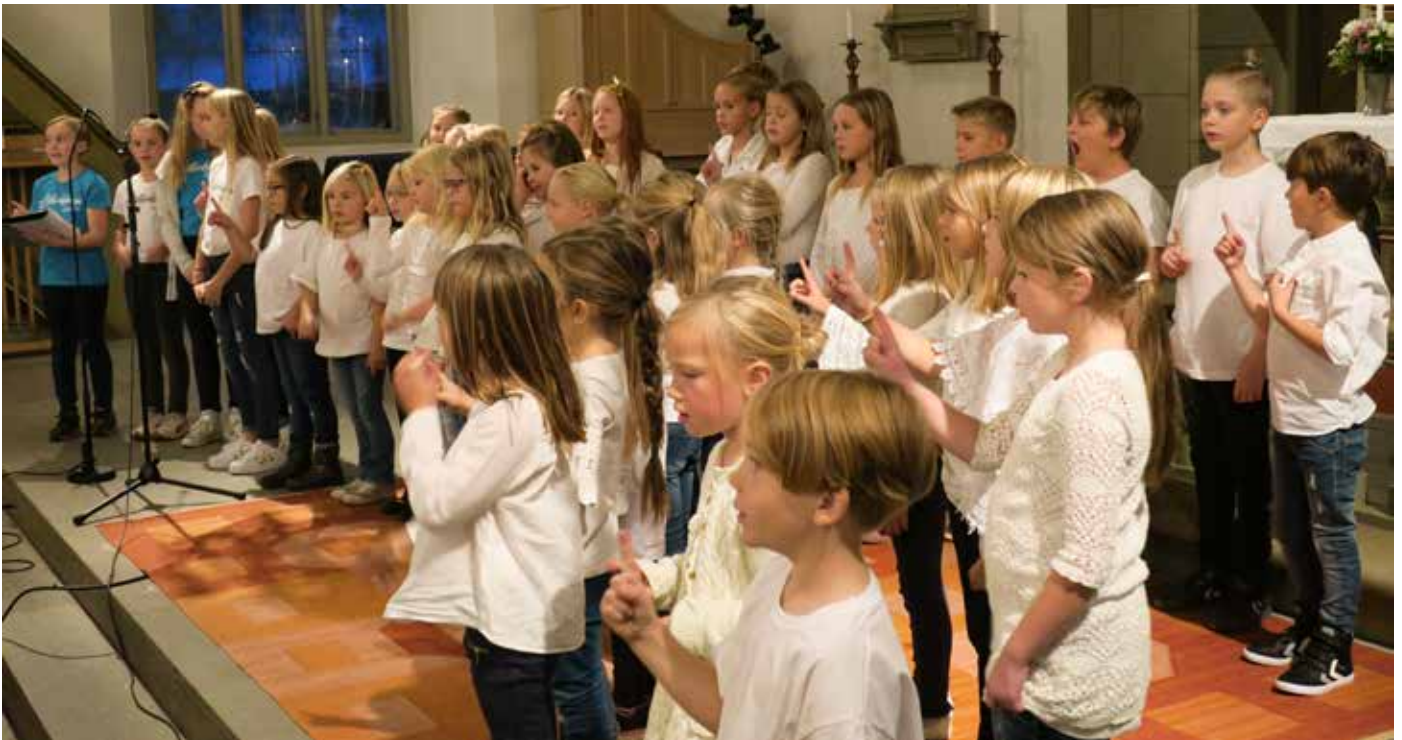
Konsert med barnkörerna på FN-dagen 24 oktober.