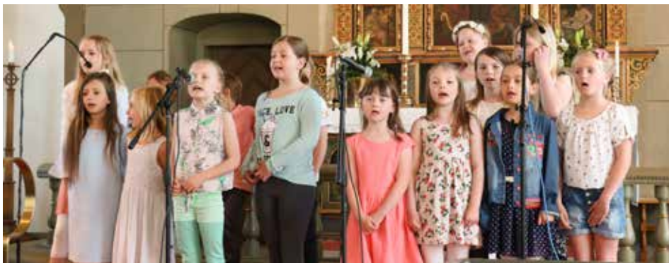
Församlingens barnkörer och barngrupper medverkade vid bönsöndagens familjegudstjänst med konsert "Tutti Frutti" den 6 maj, där även "Bibel för barn" delades ut till församlingens 6-åringar.