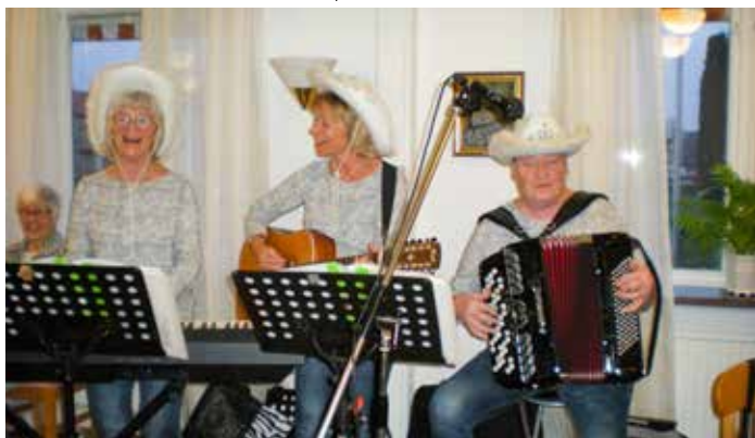
"3 på G" – Goa Glåa Gräbbor underhöll Torsdagsträffens besökare den 13 september.