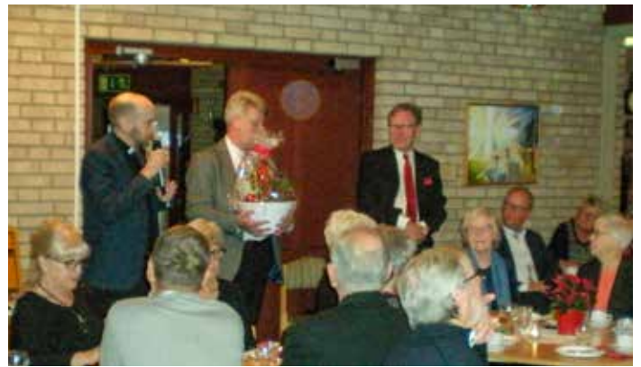
Mjällby församling uppvaktar vid Listerkyrkans 40-årsjubileum den 11 december 2017.