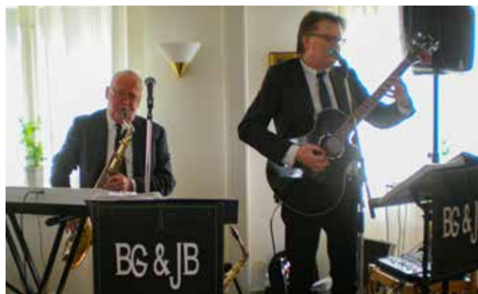
BG och JB bjöd Torsdagsträffens besökare på "Musikaliska pärlor från förr" den 12 april.