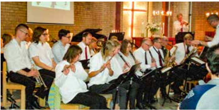
Listerkyrkan firar 40-årsjubileum den 11 december 2017.