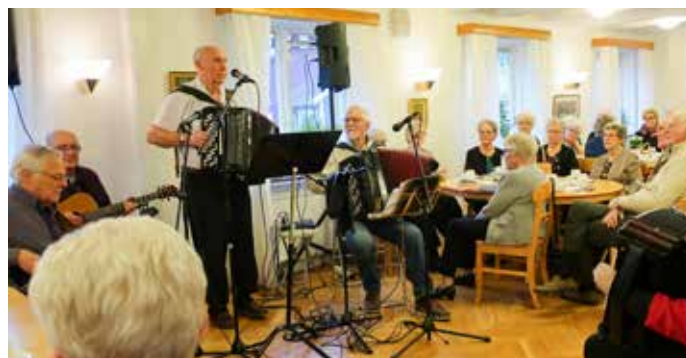
Listergänget underhöll på Torsdagsträffen den 18 januari.