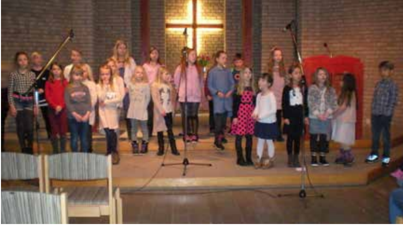
Spaghettigudstjänst med barnkörerna i Listerkyrkan den 11 februari.