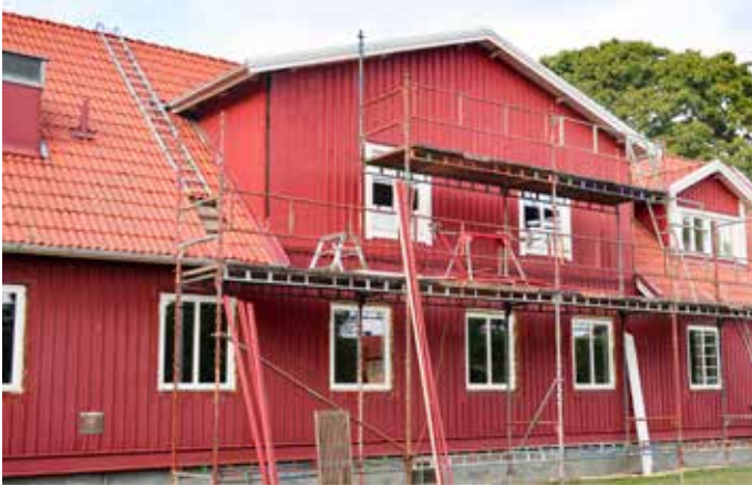
Hösten 2018 byttes fasaden och fönstren på Mjällby församlingshem.