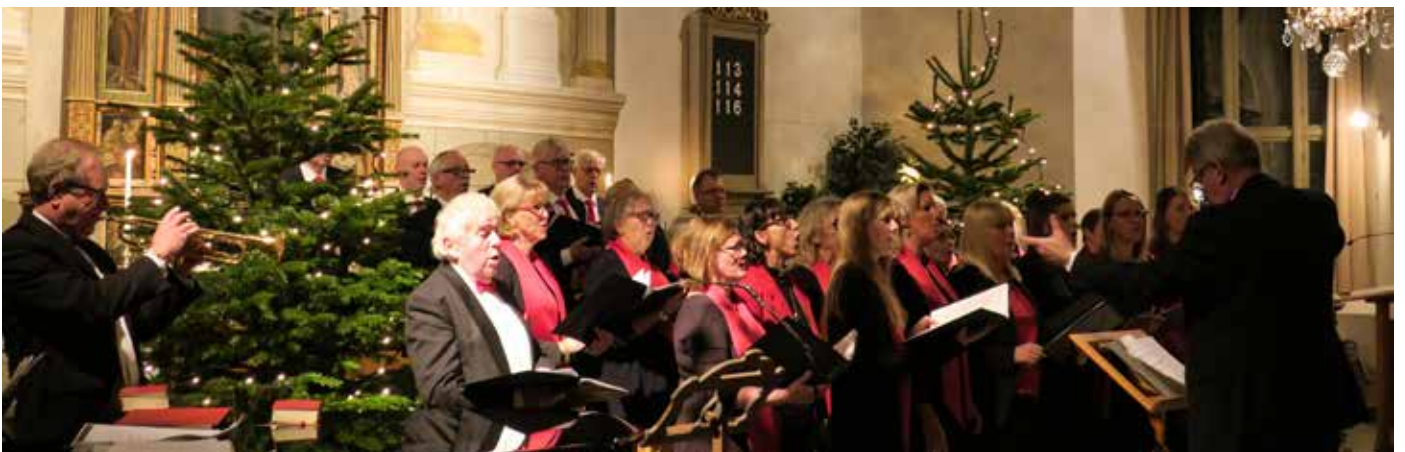
Julkonsert 17 december.