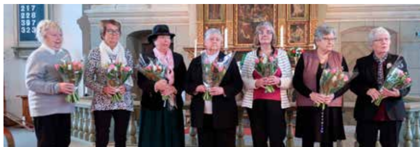
Avgående förtroendevalda avtackas vid högmässan den 21 januari.