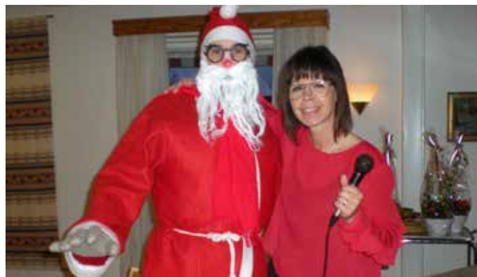
Tomten besökte Torsdagsträffens julfest den 14 december!