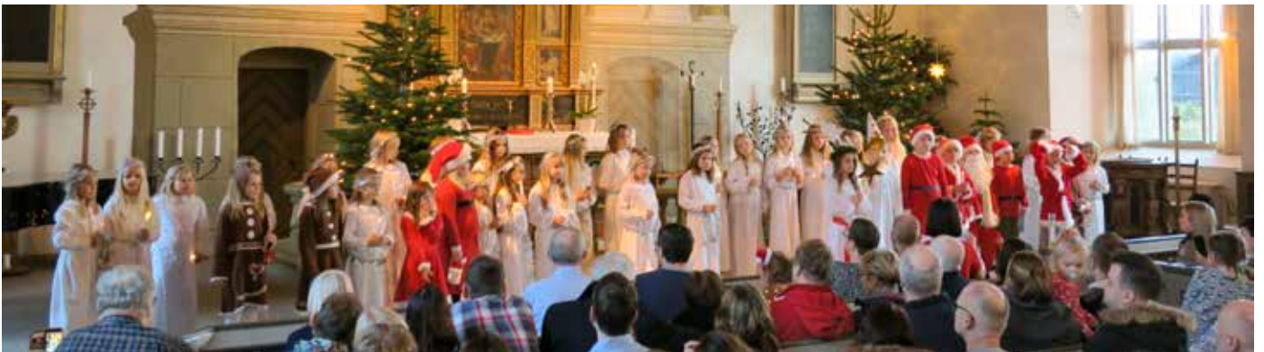
Barnkörernas luciatåg 16 december 2017.