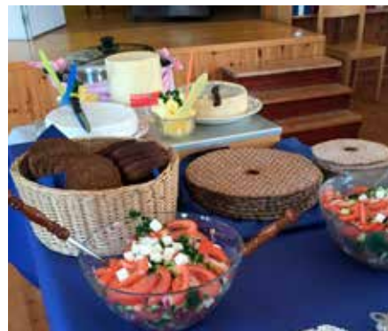
Lunchdags i Hanö Missionshus efter gudstjänsten på Hanödagen den 21 juli.