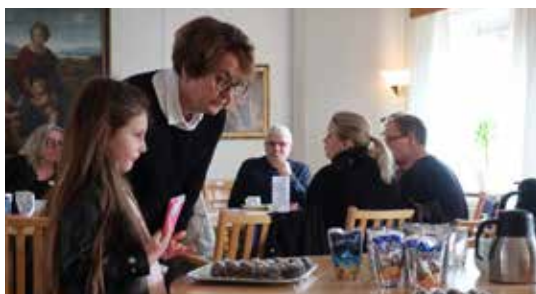
Kyrkkaffet på Palmsöndagen den 23 mars smakade bra för både små och stora.