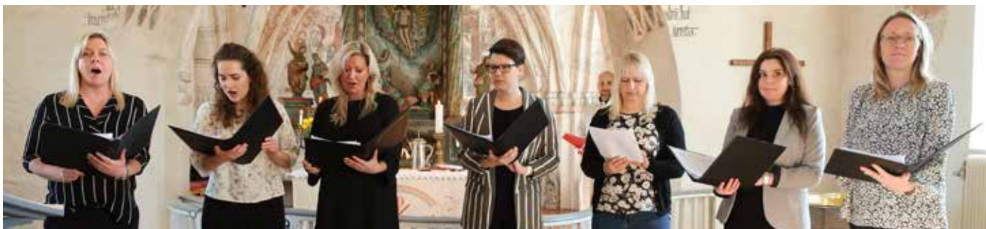
Yganokören medverkade vid mässan annandag påsk i Ysane den 2 april.