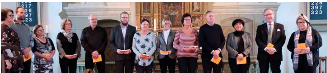
Nya förtroendevalda välkomnas vid högmässan den 21 januari.