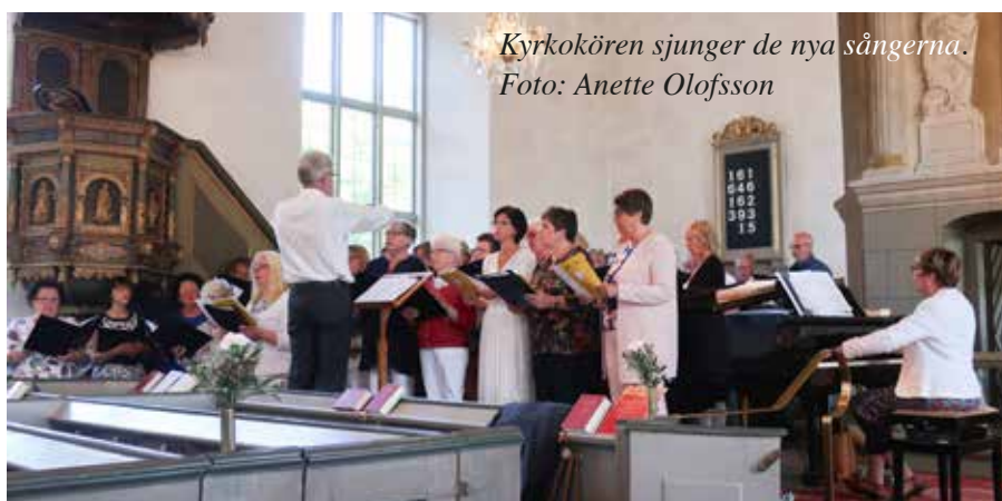
Kyrkokören sjunger de nya sångerna.

Senast Svenska kyrkan tog en ny kyrkohandbok i bruk var 1986 och detta är den åttonde officiellt antagna sedan reformationen. Kyrkohandboken innehåller ordningar för Svenska kyrkans gudstjänster, till exempel dop, vigsel, begravning och högmässa. Den nya handboken ger stora möjligheter att anpassa gudstjänsterna för såväl