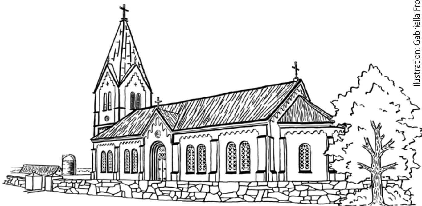
Illustration: Gabriella Fromholt