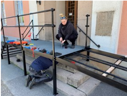
Rampen under slutmontering

En tröttsam klyscha kanske men precis innan semestertiden började levereras den nya kyrkbussen av märket Toyota. En silverfärgad buss som ska få passande dekaler på rutorna. Den ska inför hösten ersätta den vita Ford Transitbussen som kommer att användas inom vaktmästariet och kyrkogårdsförvaltningen.