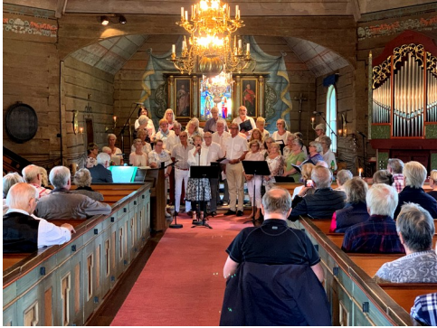
Må Bra Kören

Som vanligt hade församlingen ett brett musikaliskt utbud under sommaren. Först ut var Må Bra kören som sjöng i Kvistbro kyrka 2 juni. Därefter följde programmet ”Musik i sommarkväll” med varierande temata på sommarvisor, jazz och musikalmusik i våra kyrkor från juni till i mitten av augusti.