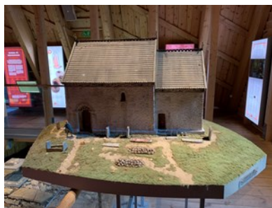
Katas gårdskyrka 1040