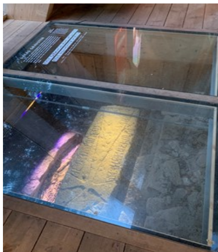
Katas gravsten—notera korset och runskriften