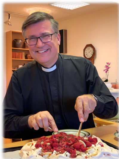
Jubilaren på Furuhöjden.

Den forna statskyrkan hävdar sin existens med att vara en folkskyrka. Det går så länge flertalet svenskar har sin tillhörighet till Svenska kyrkan. År 2000 var av 8,8 miljoner svenskar ca 83 % tillhöriga. Genom migrationen och sekulariseringsprocessen är vi 20 år senare 10 miljoner invånare med runt 58 % tillhöriga. Det är dramatiska förändringar som skett och fortgår inom kyrkliga organisationen med stora utmaningar för alla engagerade som anställda, förtroendevalda och lekmän. Kyrkan har blivit ”kontoriserad” med IT-teknik. Men så har det också varit för skolan, vården, polisen och försvarsmakten för att nämna några exempel. Jämfört med dessa organisationer har Svenska kyrkan klarat sig bra för att vara en organisation med rötter ända ner i vikingatiden!