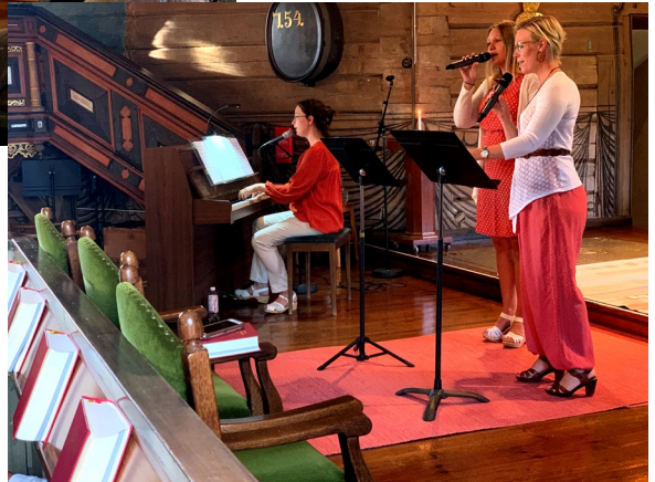
Kahjenn i Kvistbro