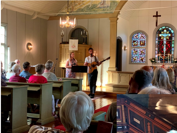
Musikaler i Mullhyttan

Som vanligt hade församlingen ett brett musikaliskt utbud under sommaren. Först ut var Må Bra kören som sjöng i Kvistbro kyrka 2 juni. Därefter följde programmet ”Musik i sommarkväll” med varierande temata på sommarvisor, jazz och musikalmusik i våra kyrkor från juni till i mitten av augusti.