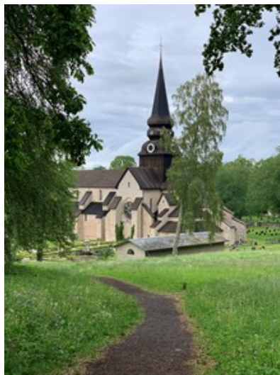
Varnhems klosterkyrka 1150