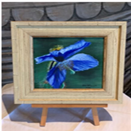
Siw Nilssons blommotiv

Vackra naturmotiv blandades med humoristiska älgar.