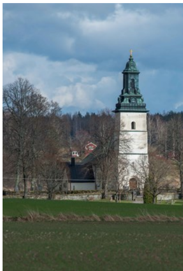
Knista kyrka 1123

I början av juni månad var vi några från församlingen som gjorde studiebesök i Varnhem klosterkyrka borta i Västergötland. Denna kyrka byggdes ungefär 25 år efter Knista kyrka som dateras till 1123. Här i Varnhem begravdes många medeltida kungar innan kungariket Sverige ens fanns på kartan! Bland annat portalgestalten Birger Jarl (1210-1266) som ses som grundare av nuvarande huvudstaden Stockholm som enligt de isländska sagorna hade det konstiga namnet Agnefit under förhistorisk tid. Det är märkligt att denne man ligger begravd just här i Västergötland och inte i Stockholm?! Det visar möjligen på platsens viktiga betydelse när Västergötland smältes samman med Svealand och Östergötland.