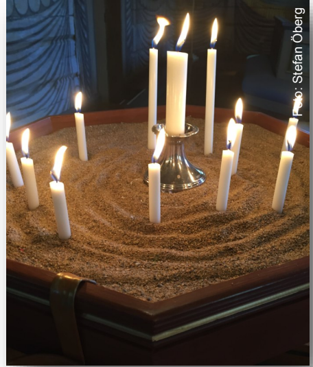
En bild på förbönsljus