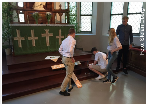
Förberedelser inför redovisning