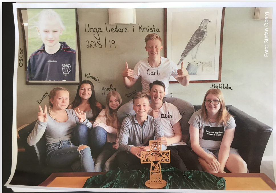
Bild på årets konfirmander och ungdomsgrupp