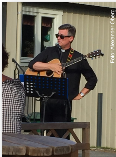
Undertecknad stod för psalmsången