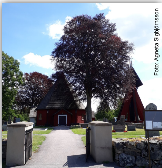
Kvistbro kyrka och kyrkogård

Knista församling, Storgatan 28, 716 30 Fjögesta