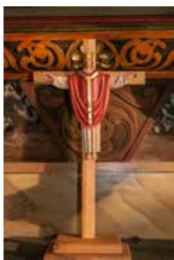
Segerkorset - även kallat triumfkrucifix. Jesus avbildas som kung.