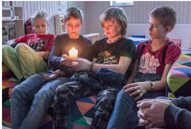
Barnen skickar runt ljuset och ber.

Så här kan det låta: "Tack Herre för att vi får träffas här och ta hand om alla dessa fina barn." "Tack för att du alltid hör oss." "Var med och beskydda oss." "Jag ber för min lillebror att han ska bli frisk." Jag ber för min mormor som är sjuk."