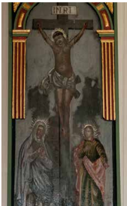
Långfredagskorset - här hänger den döde Jesus. Tavla i Mollösunds kyrka