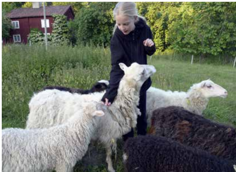
Seden att äta lamm på påsk är gammal i Bohuslän