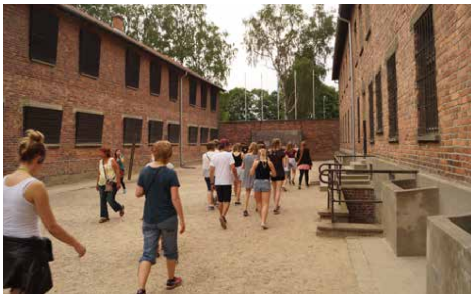
Koncentrationslägret Auschwitz Birkenau.

Under eftermiddagen besökte vi ett kloster där svarta madonnan finns. Efter fika i magen begav vi oss till Krakow där vi checkade in på hotellet, åt mat och la oss i våra sängar.