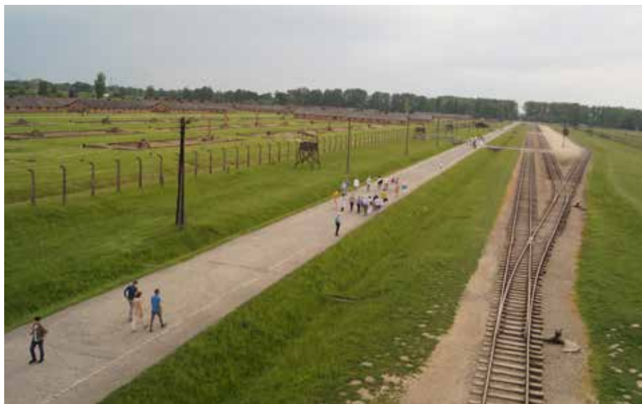
Koncentrationslägret Auschwitz Birkenau.