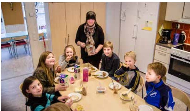
Mellanmål smakar gott efter skolan.