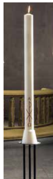
Kristusljuset - Vad ljus över griften...