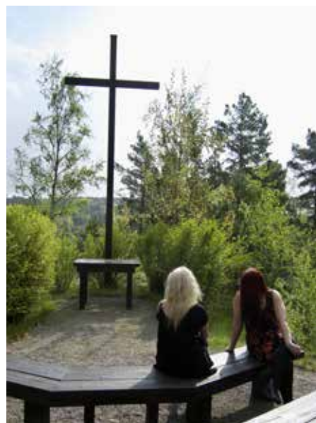
Påskdagskorset - döden kunde inte hålla kvar Jesus