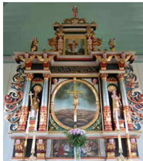
Altartavlan i Käringöns kyrka

När du lämnar kyrkan kanske du får med dig någonting från bokbordet eller helt enkelt en känsla. Förhoppningsvis är det något som stärker dig. Det är därför kyrkan står öppen för dig.