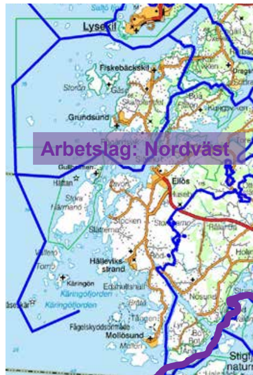
Vår verksamhet i församlingarna är uppdelade

"Kyrkorådet har själv inget operativt mandat."