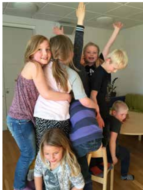
Vänlighet - Godhet

Text Britt-Mari Karlsson, församlingsassistent. även fotograf till fotona Tålmod och Självbehärskning resterande fotografier har Rebecka Persson fotograferat