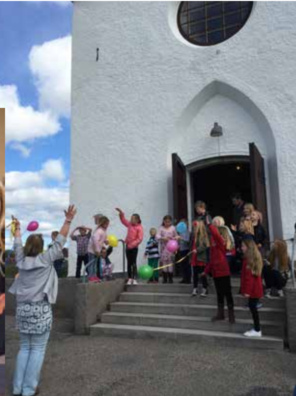
Vilken färg har vinden?

”Om du inte tar emot Guds rike som ett barn kommer du aldrig dit in” ungefär så är andemeningen i Markus Evangeliet och på flera andra ställen i Jesu undervisning.