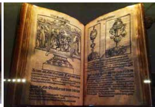
Längst t.v. Luthers arbetsplats på Wartburg. Porträttet t.v. visar Luther som vi ofta ser honom på. Det t.h. visar honom på dödsbädden. Han dog efter en tids sjukdom. Boken är en av de tusentals skrifter som Martin Luther författade under sin livstid.