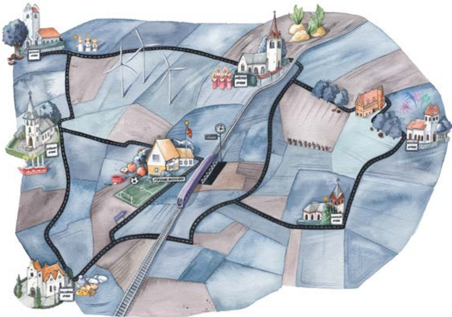
Illustration: Jenny Lindquist

TORNS FÖRSAMLING finns där horisonterna öppnar sig, där landsbygd möter stad och tradition möter utveckling. Församlingen består av sex kyrkor: Stångby, Vallkärra, Igelösa, Västra Hoby och Håstad samt den nedlagda kyrkan i Odarslöv. Varje söndag firas det högmässa i någon av kyrkorna och i veckorna pågår verksamhet i församlingsgården i Stångby.