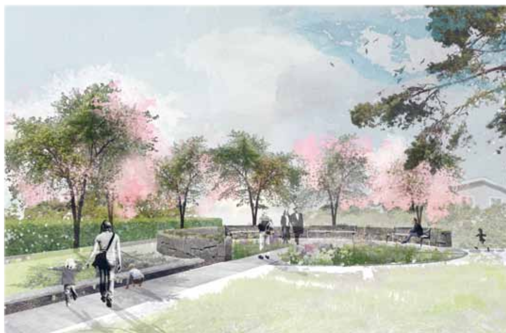
Arkitektsskiss på askgravlund vid S:t Eriks kyrka