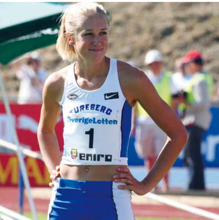
Kajsa Bergqvist blickar ut över publiken på Sollentunavallen i samband med SM i friidrott 2006.