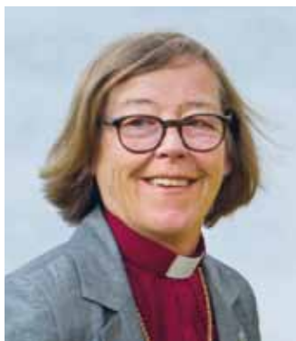
Biskop Eva Brunne

– Att sluta köpa ut åt unga är viktigast. I kyrkan erbjuder vi en miljö som är alkoholfri och det behöver vi göra mer och mer, så att vi är en plats där du får vara den du är. Kyrkan kan också föregå med gott exempel genom att göra nattvarden al-