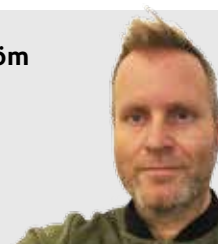
ILLUSTRATION: HELENA BÖLING