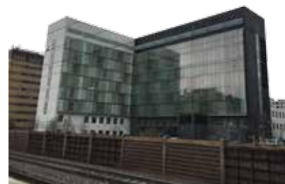
Häktet i Sollentuna är ett av Kriminalvårdens säkerhetshäkten och ligger i Sollentuna centrum, häktet har 240 platser, varav 25 särskilda ungdomsplatser.

– Jag får så mycket energi av att vara där. Det känns angeläget att få in lite ljus och hopp och jag tror nog att jag gör någon form av skillnad.