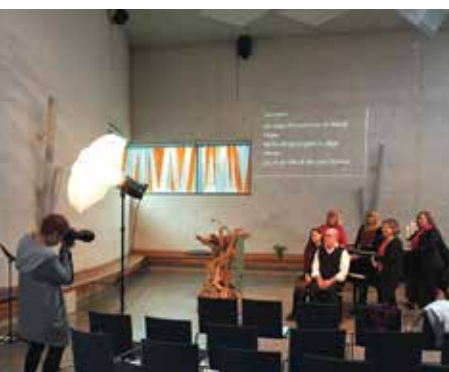
Apelsiner, kottar, ljusstakar och sju juliga musiker. Allt som behövs för att ta omslagsbilden till detta julnummer av Kyrkporten.