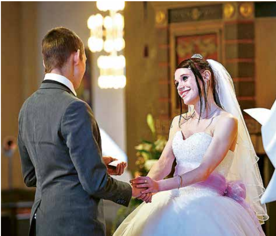
Under sommarmånaderna firas det många bröllop i Sollentuna.