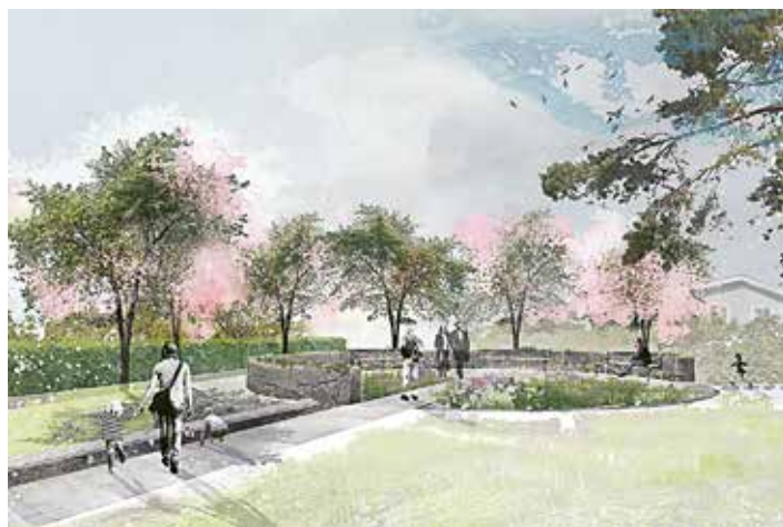
Den nya begravningsplatsen vid S:t Eriks kyrka kommer att vara öppen för alla trossamfund.

– Svenska kyrkan har ett uppdrag från staten att ombesörja begrävningar och gravsätt-