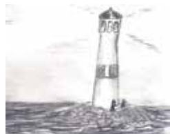
ILLUSTRATION: KJELL DELLERT

Temagudstjänst Tema "Förväntan & melankoli" Texter av Tove Jansson Ingrid Malm Lindberg Kjell Dellert Edsbergs kyrkokör