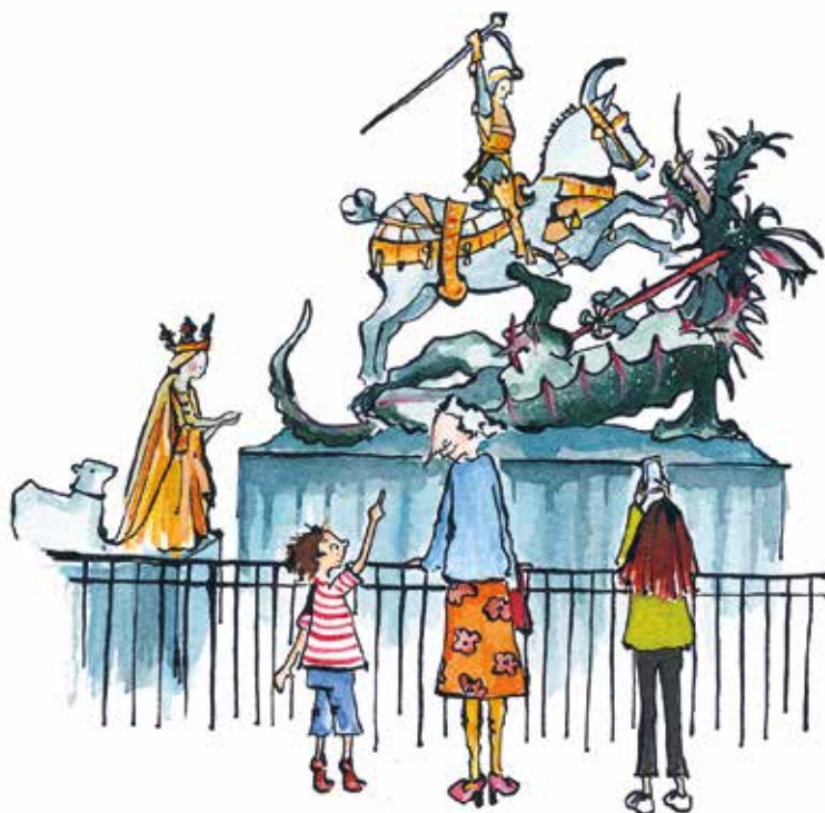
ILLUSTRATION: ANNA BLÅDER

– För mig växte mycket fram när jag läste Ulfs manus. Det var ganska klart från början hur huvudkaraktärerna skulle se ut, medan andra delar har fått utvecklas under resans gång. Det handlar både om helheten och detaljerna som måste bli rätt, berättar Anna.