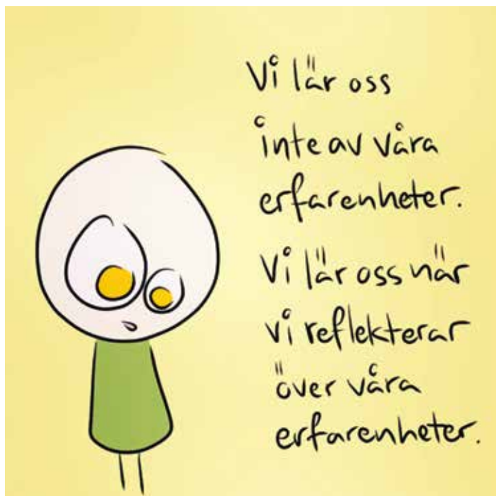
ILLUSTRATION: ROYNE MERCURIO

Sollentuna församling och Sollentuna Bil & Motor har ett insamlingspartnerskap sedan 2014.