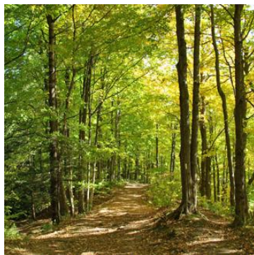
Vandringsled i Rouge Park

Pilgrimsvandringen börjar med en presentation av alla som deltar. Vid varje rast håller vi en kort meditation. Vandringen som är cirka 5 km inbjuder till stillhet under både gemensamma samtal och enskild tystnad. Många pilgrimsvandrare uppskattar ofta tid för både egen reflektion och utrymme för att dela tankar med andra. Vi håller rast 15 minuter efter varje vandringstimme med en långrast mitt på dagen för mässa i det fria och medhavd lunch.