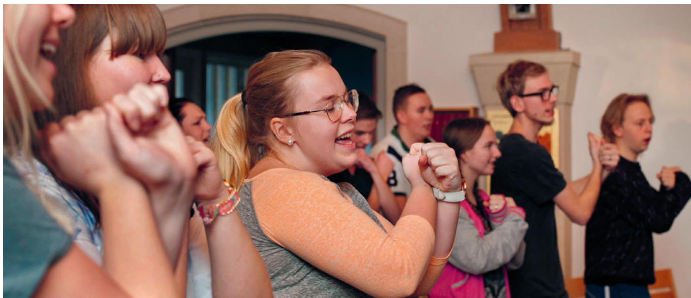
Att sjunga gospel med hela kroppen ägnade sig en grupp åt under lägret "Gnistan" på Flämslätts stiftsgård i mitten av januari.