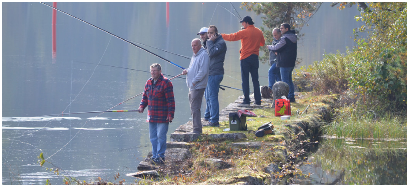
Integrationsarbete kan ske på olika sätt. Bilden är tagen vid en fiskeutflykt i Götene pastorat.

Text: Sven-Erik Falk