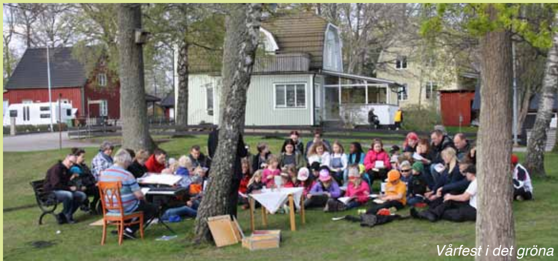
Vårfest i det gröna