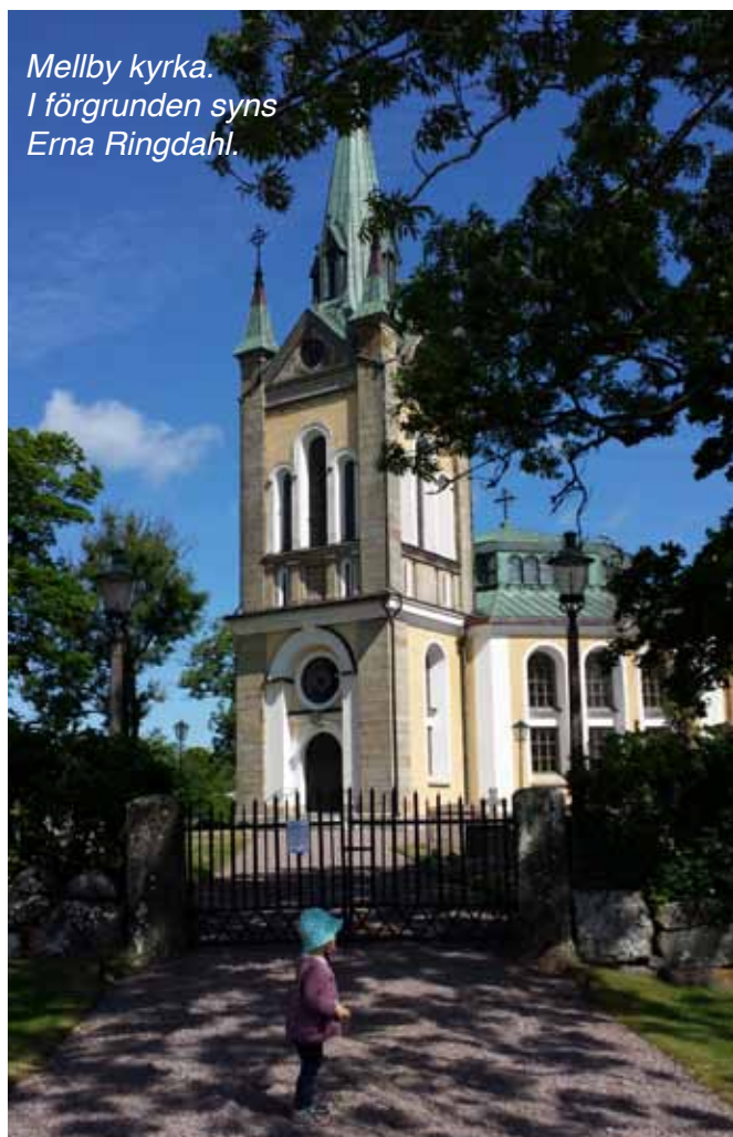
Mellby kyrka. I förgrunden syns Erna Ringdahl.

Anmäl dig senast den 8 juni till pastorexpeditionen (se kontaktuppgifter på sidan 2).