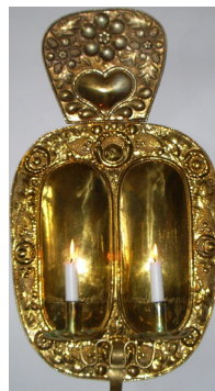
Mässingslampetter- i olika storlekar från 1700-talet några skänkta av församlingsbor.