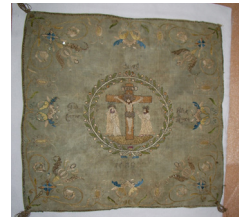
Kalkduk- Kopia på södra långväggen.