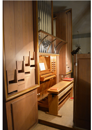
Stora orgeln- Är en sk “Barockorgel” och har ett fodral av trä och pipor av trä och metall. En del av piporna kommer från den gamla orgeln från 1894. Orgeln om-fattar 21 stämmor fördelade på två manualer och pedal, helmekanisk, byggd av Grönlunds orgelbyggeri i Gammelstad 1957.