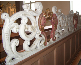
Korskrank- Akantus-ornamentik (bladornamentik). Målat trä i form av två stiliserade ok, rödmålade och förgyllda samt krönta av förgylld krona. Gjorda av Hans Biskop 1748.