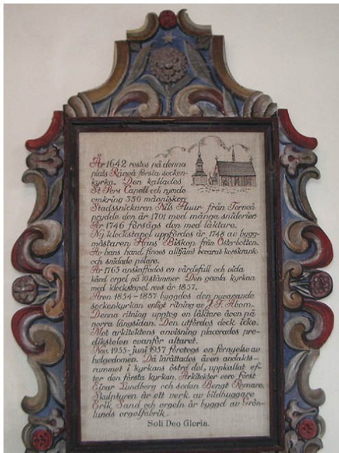
Historik över kyrkan, Ram från 1700-talet