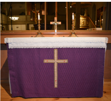
Altare från Orrbyns kapell