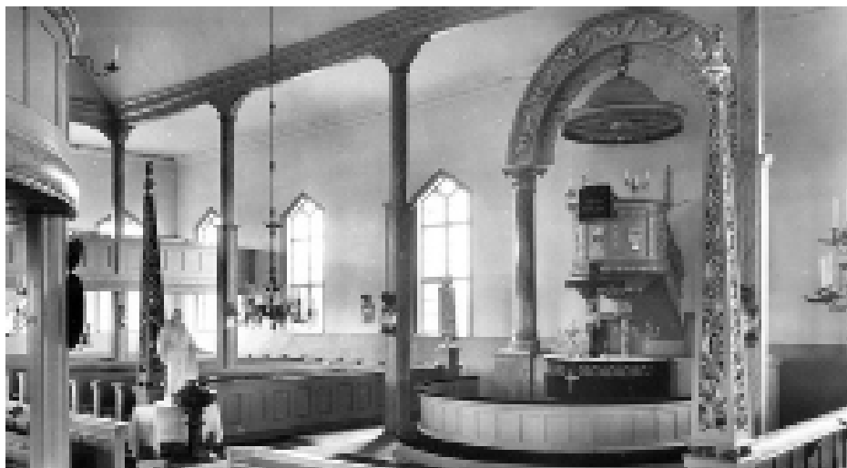
Interiör Råneå Kyrka. Bilden fotograferad före år 1954