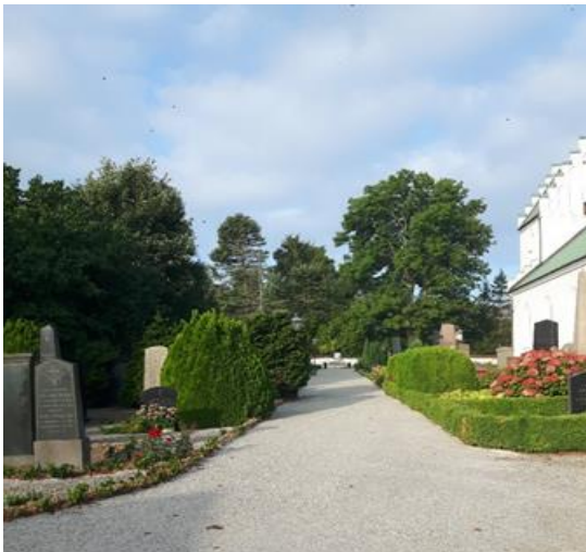
Plattgången i Räng är ersatt med samkross

Plattläggningsytan vid orangeriet utökades och gräsytan efter grävarbeten till kyrkans renovering har iordningställt och brunnar justerats. Gamla vaktmästarbyggnaden har rivits och gång och gräsmatta anlagts. Förberedelser för vattenutkast har gjorts.