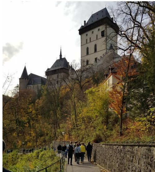
Besök på Karlsteins slott- oktober 2018

Året har också innehållit vårt traditionella trettonhelgsläger i Kyrkans hus med 65 deltagare med gäster från Skänninge och Västervik, Lajv under Kristihimmelfärdshelgen utanför Skillingaryd och Konvent i Skänninge i oktober.