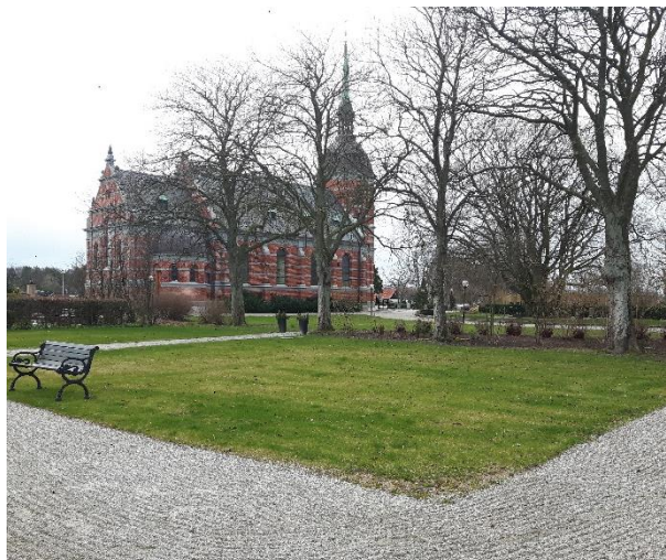
Gamla vaktmästarhuset på St Hammar har ersatts med gräsyta och gång.