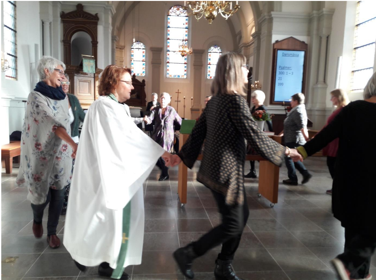
Dansmessa i Stora Hammars kyrka Din ljusa skugga som Huvudgudstjänst 28 oktober 2018

Den stora dansdagen anordnades och vi har firat en dansmessa med Mikis Theodorakis tema, med grekiska danser. Projektet Dansa tro dansa liv i Värmland avslutades och Din ljusa skugga har genomförts 2 gånger. En gång som kvällsmessa och en gång som Huvudgudstjänst. Båda enligt nya handboken. Planering för SVT gudstjänster startade.