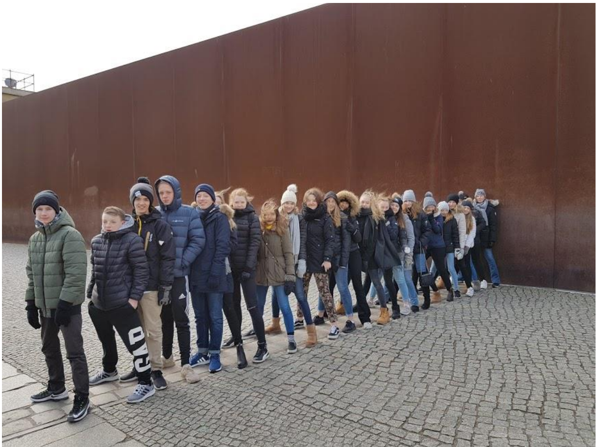
Resegruppen med en fot i VästBerlin och en fot i Östberlin