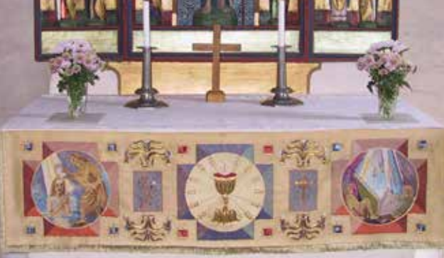
Altarbrun, broderad altarduk, tillhör Götene k:a Gjord av Agda Österberg 1942