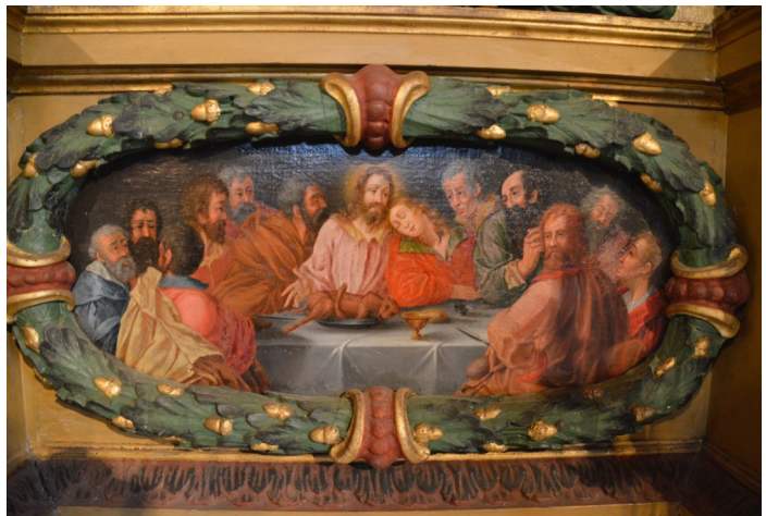
Tydlig koppling mellan nattvarden och offerlammets, på altartavlan i Skagershults gamla kyrka.

Därför sjunger vi till Guds lamm när vi tar emot hans kropp som utgivits för oss, och hans blod som utgjutits för oss. Men det slutar inte bara med att Guds lamm slaktas för vår skull. Bibelns sista bok, Uppenbarelseboken, är mättad med symboler. En av dem är ett lamm, som såg ut att blivit slaktat (Upp 5:6). Trots det är lammet livslevande, och inte nog med det – lammet får ta emot lovsång, ära, och härlighet i evigheters evighet, tillsammans med Gud själv (Upp 5:13). Lammet var berett att offra sig själv för Guds kärleks skull, och får därmed också dela Guds härlighet. Därför finns det i många kyrkor en bild på ett lamm som håller en flagga med ena frambenet – en segerfana. Detta är det mest radikala exemplet på att den som ödmjucar sig för kärlekens skull ska bli upphöjd av Gud. För oss är det en gåva att ta emot och en förebild för vår livsstil.