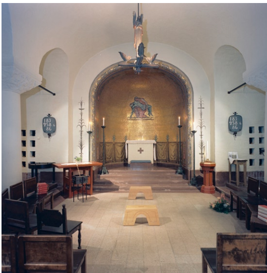
S:t Ansgarskapellet mot kor .

S:t Ansgarskapellet, som är inrymt i öster under koret, byggdes som gravkapell men nyttjas idag för alla typer av förrättningar. Det utgörs av ett treskeppigt litet rum med absid i väster. Det tunnvalvda taket bärs upp av kraftiga kolonner med kapital med skulpterad dekor av ignabergakalksten. Samma stensort finns i altaret. Absidens valv och väggar är täckta av en guldmosaik med Pietàmotiv , utfört av Einar Forseth. Väggar och valv i övrigt är vitslammade, kring entrén i öster och absiden i väster försedda med dekorativt måleri och textband. Golvet är av kalksten. Armaturerna i form av ljuskronor med skulpterade figurer i trä och mässing samt ljusarmar i koppar är ursprungliga. De brunlaserade stolarna är också från byggnadstiden. Det fristående altarbordet och dopfunten är liksom vindfånget sekundära.