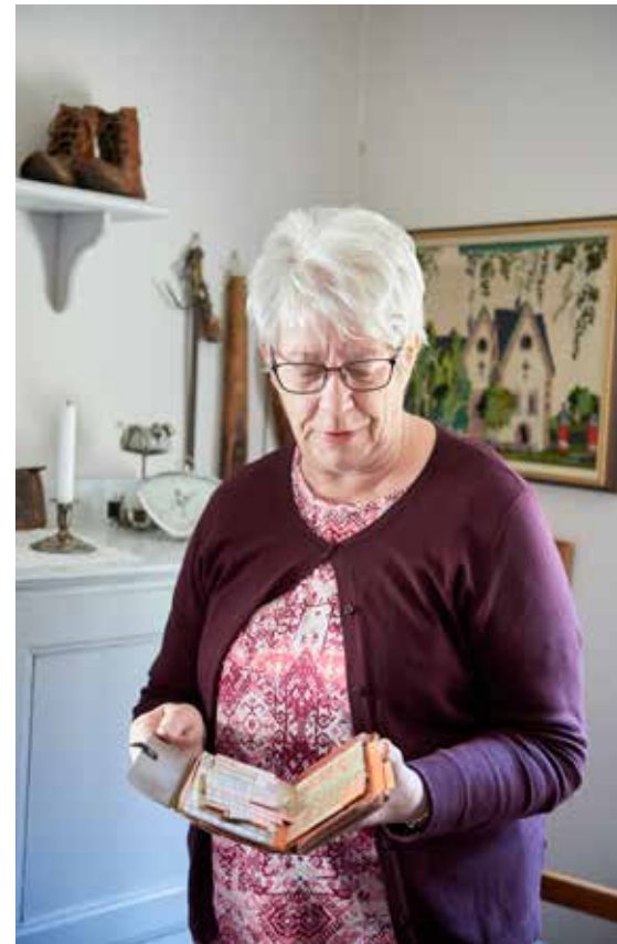
Ransoneringskort från efterkrigstiden med kuponger till bland annat kaffe och socker.

En minnessten över de kungliga besök som gjorts i Öjebyn under 1900-talet. Kungarna och drottningarna har här skrivit sina namnteckningar och året för sitt besök.