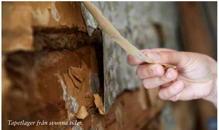
Tapetlager från svunna tider.

– En kyrkstuga kan ha byggts på 1700-talet, men innehåller olika stilar från olika epoker i ett och samma rum. Och det tycker jag att det kan få göra.