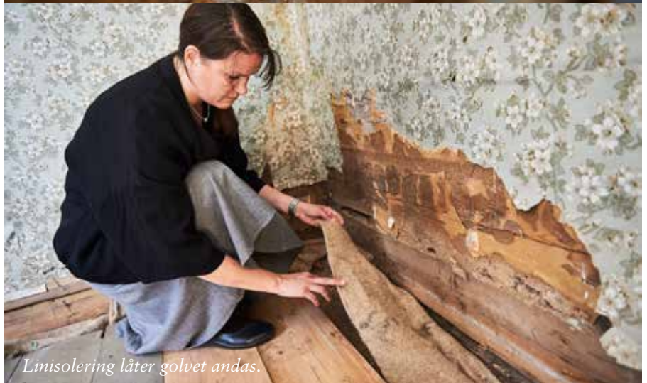
Linisolering låter golvet andas.

– Man kanske inte lade jättemycket tid på kyrkstugor förr i tiden. Man tog hit gamla möbler hemifrån när man skulle sova över helgen. Det var inte så märkvärdigt, och det behöver det inte vara idag heller.