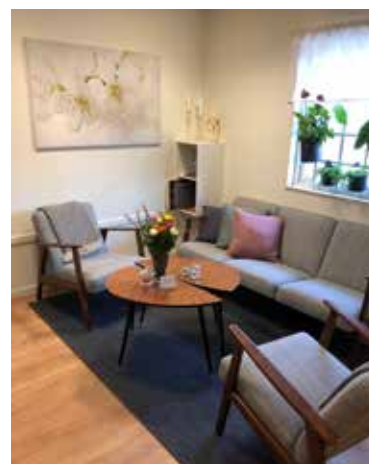
OMBONAT. Soffgruppen på det nyrenoverade kontoret inbjuder till förtroliga samtal.

Några vanliga frågor är: Vad händer när man dör? Kan man vakna igen? Kommer människor och djur till samma himmel? Andra barn kan på ett säkert sätt berätta om vad som händer efter döden, till exempel fick jag höra följande: "Vet du, när man dör så blir man