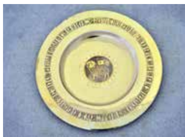
PATÉNE FRÅN 1300-TALET.

Kalken, bågaren, hade bara en liten kupa under medeltiden, eftersom det bara var prästen som tog del av vinet i nattvarden. Efter reformationen erbjuds både brödet och vinet till församlingen, och därför förändrades kalken så att kuppen blev större, och då behövde också fo-