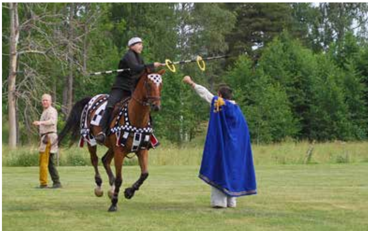
SPETSAD. Riddarsällskapet Celeres Nordica bjöd på en fartfylld uppvisning som imponerade.

För andra året arrangerades medeltidsdag på Aspås. Trots några hotande regnstänk blev det en lyckad dag. Bilderna visar lite av vad som hände under dagen. Kyrkans intäkter, 4 270 kr, gick till Stiftelsen Min Stora Dag.