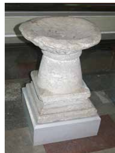
DOPFUNTEN FRÅN 1200-TALET.