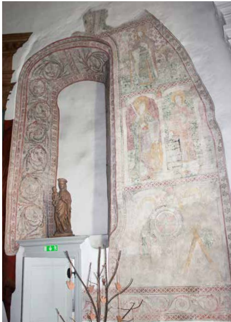
BEVARAT. Väggmålningar från 1400-talet. Ovanför dörren står Madonnaskulpturen från samma tid.